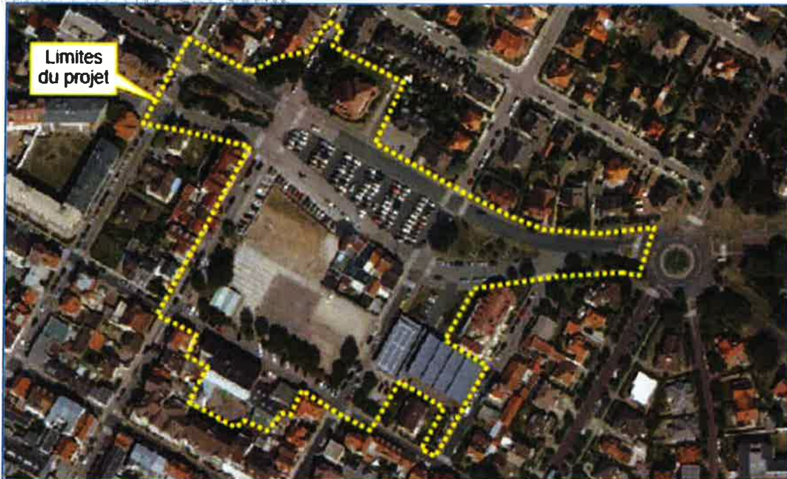
Vue aérienne du projet à l'échelle du quartier